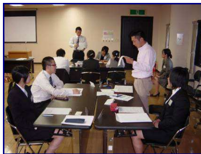
↑ グループディスカッション・発表