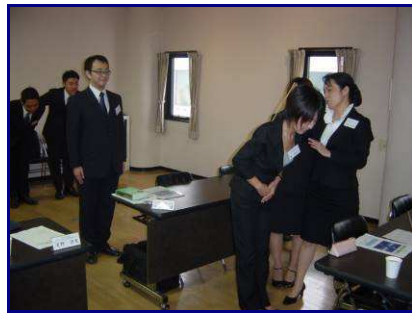
↑ 立ち姿勢・挨拶トレーニング