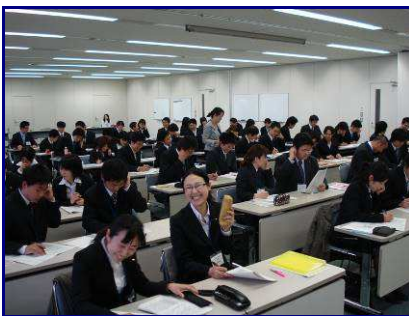
↑ 電話対応トレーニング