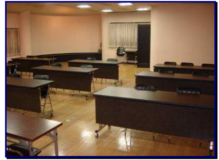
↑ 当社2F研修室のご紹介（左より 研修室入口から、研修室後方から、研修室前方から）↑