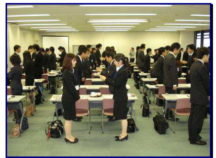
↑ 名刺交換・接遇トレーニング