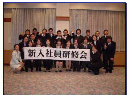
↑ 参加者全員での記念撮影